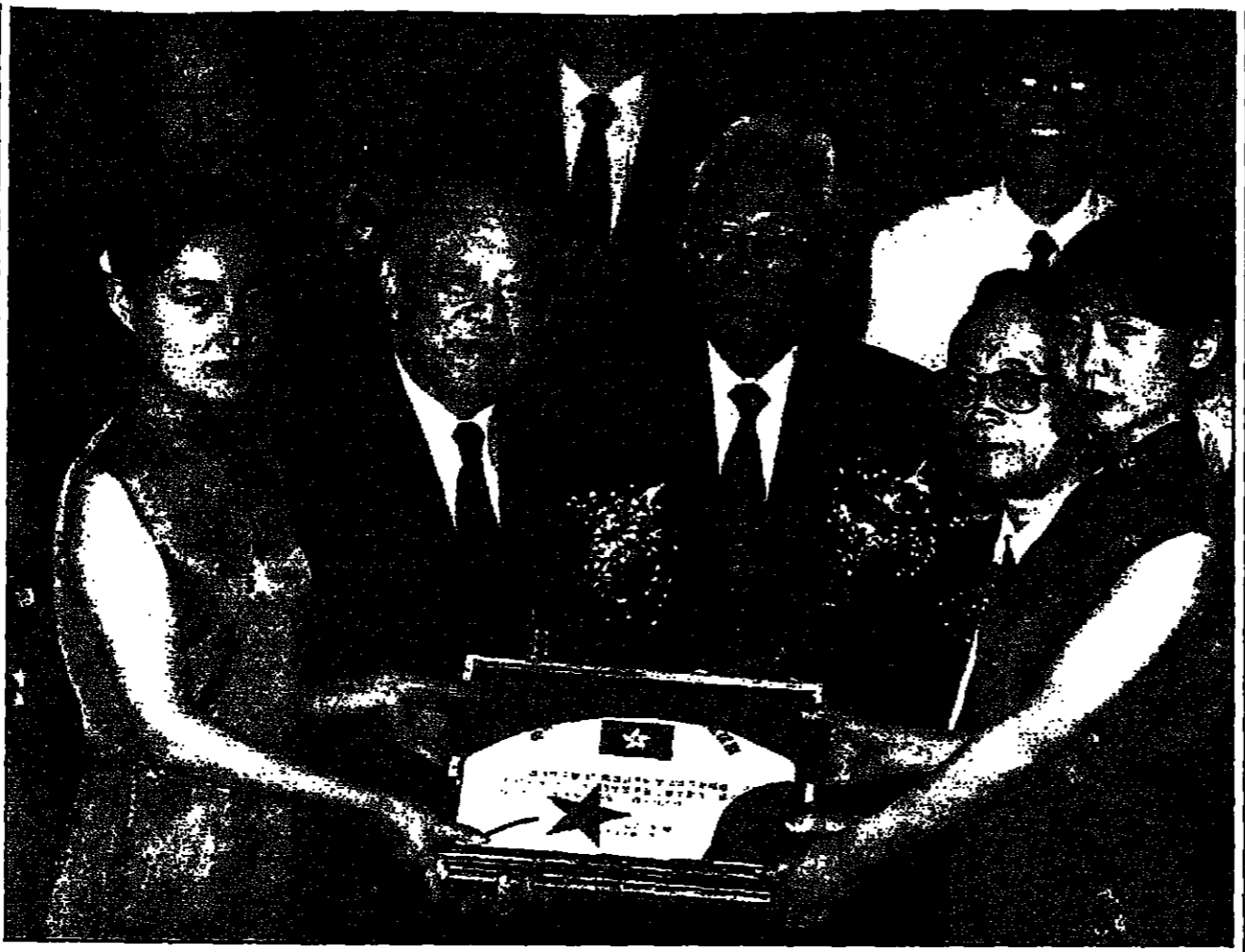
مديرة رومية مبرارة من علم الصين داخل صندوق كان قد اطلق في الخفاء تسلمه احد مدراء شركة كورنغ (الليل) الذي يتولى منصبه يوم 30 من الشهر المقبل